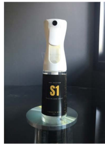
SPRAY BOTTLE 250 ml. 350 บาท