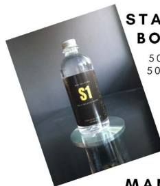
START UP BOTTLE 500 ml. 500 บาท