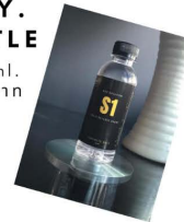
D.I.Y. BOTTLE 250 ml. 250 บาท