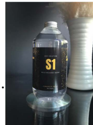
MANUFAC. BOTTLE 1000 ml. 1000 บาท